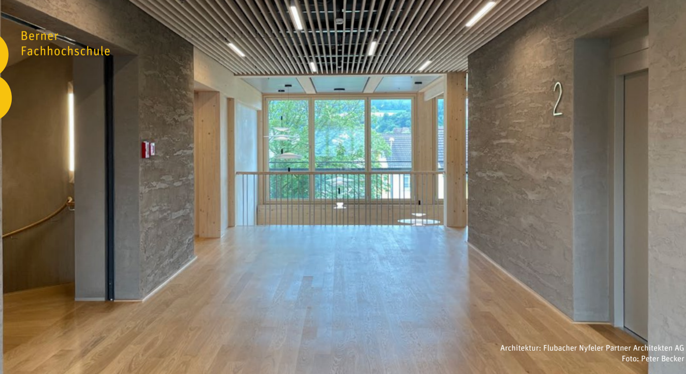
Architektur: Flubacher Nyfeler Partner Architekten AG