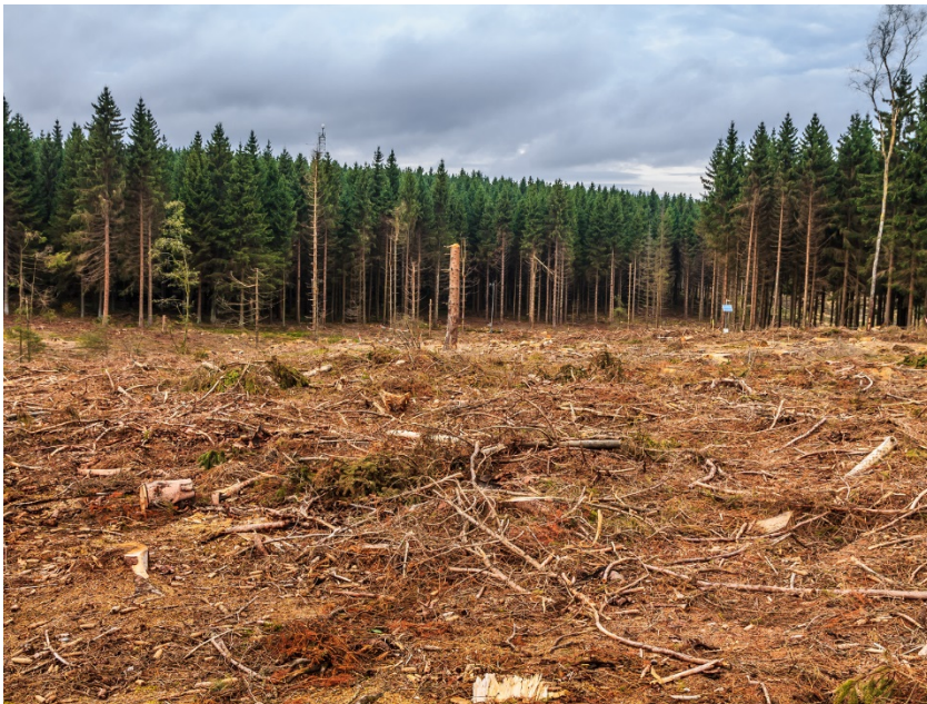
Coupe rase controversée de 8 ha de forêt en Allemagne