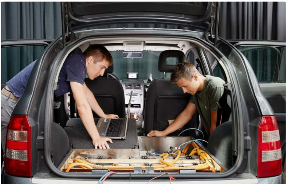
Retrofitting (conversion) d'une Audi A2 en véhicule électrique.

Pour en savoir plus le projet Retrofit EV