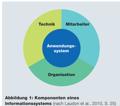
Abbildung 1: Komponenten eines Informationssystems (nach Laudon et al., 2010, S. 25)

Laudon, K. C., J. P. Laudon, D. Schoder (2010). Wirtschaftsinformatik: Eine Einführung. 2. aktualisierte Auflage. München: Pearson Education Deutschland.