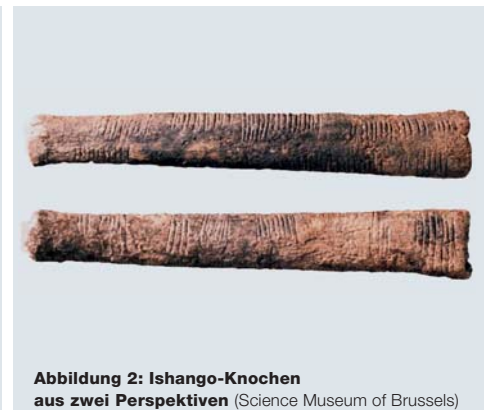
Abbildung 2: Ishango-Knochen aus zwei Perspektiven (Science Museum of Brussels)