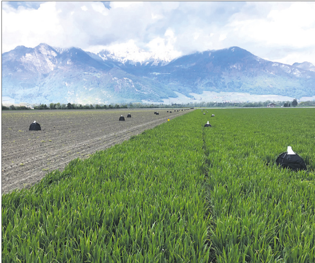
Um die Anzahl ausfliegender Zikaden zu erfassen, wurden Zeltfallen in den Parzellen ausgestellt.

Dieser Unterschied der zwei Parzellen bezüglich der Anzahl Ausflüge ist auf die Gründüngung der Parzelle in Yvorne zurückzuführen. Denn die Parzelle in Illarsaz lag über den Winter brach. Das heisst, wenn man im Winter das Feld brach lässt - u. a. kein Wintergetreide anbaut - reduziert man die Anzahl ausfliegender Zikaden. Man entzieht den Zikaden damit die Nahrung im Winter und unterbricht deren Entwicklung. Der