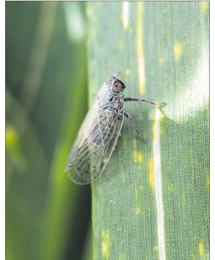
Die Schilf-Glasflügelzikade überträgt das gefürchtete SBR. Hier eine Zikade auf einem Dinkelblatt.

Ausflug dieser Insekten wird eingeschränkt und somit die Übertragung von SBR auf die neuen Zuckerrübenparzellen reduziert.